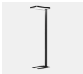
matt schwarz (RAL9005)