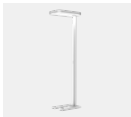
matt weiss (RAL9016)